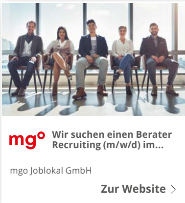
Beispiel: MRB-Technologie auf Google Display (mobil)