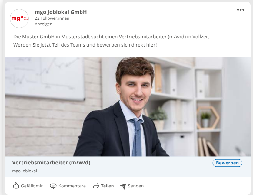
Beispiel: MRB-Technologie auf LinkedIn