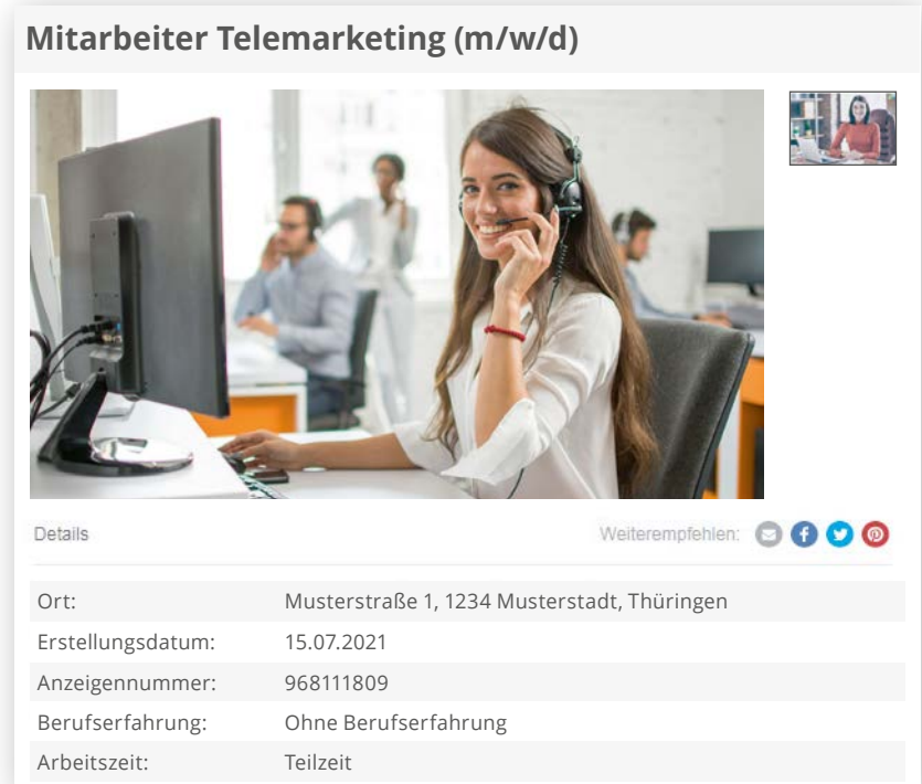
Beispiel: MRB-Technologie auf Ebay Kleinanzeigen