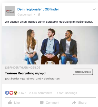
Beispiel: MRB-Technologie auf Facebook