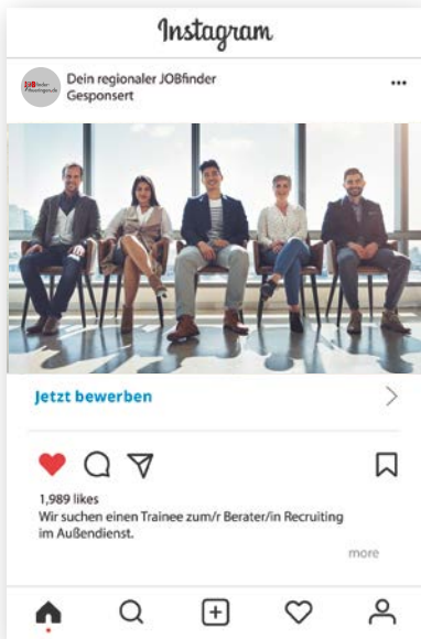
Beispiel: MRB-Technologie auf Instagram